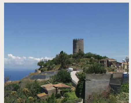
L'antico borgo di Piraino, nel Messinese