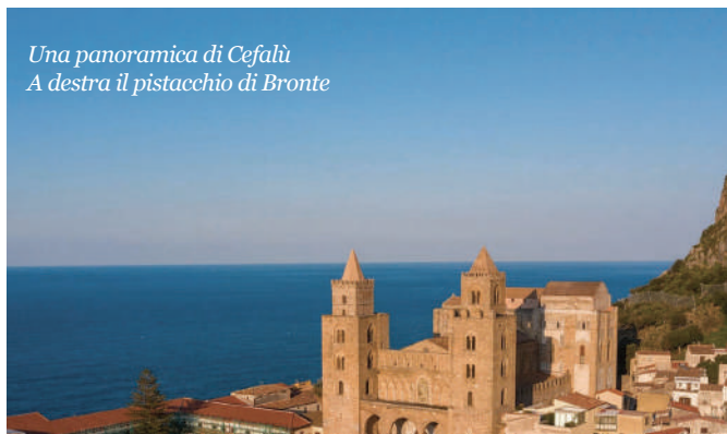
Una panoramica di Cefalù A destra il pistacchio di Bronte