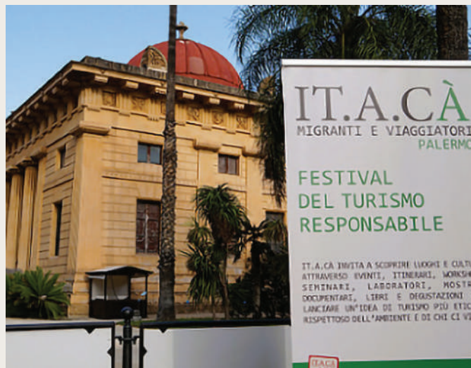
Itacà fa tappa a Palermo

Premiato dall'Organizzazione Mondiale del turismo dell'ONU per l'eccellenza e l'innovazione nel turismo il progetto, It.a.cà è il primo e unico festival italiano sul turismo responsabile che invita a scoprire luoghi e culture in maniera responsabile e inclusiva per lanciare un'idea di turismo più etico e rispettoso dell'ambiente e di chi ci vive. Un cammino unico in territori diversi, per trasformare l'incoming in becoming, coniugando la sostenibilità del turismo con il benessere dei cittadini.