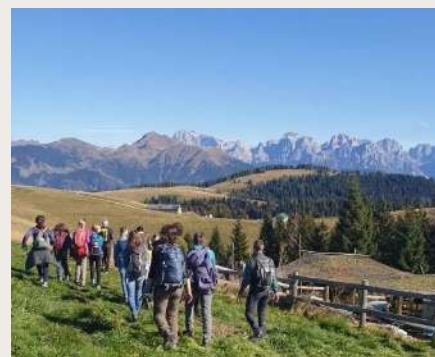
Nella valle del Panaro, in Emilia Romagna

Unite). Ogni anno il festival invita a scoprire luoghi e culture attraverso itinerari a piedi e a pedali, workshop, seminari, laboratori, mostre, concerti, documentari, libri e degustazioni. L'obiettivo è diffondere un'idea di turismo più etico e rispettoso dell'ambiente e delle comunità. Un cammino unico in tanti territori diversi, per trasformare l'incoming in becoming, coniugando la sostenibilità del turismo con il benessere dei cittadini. I destinatari sono tutti quei viaggiatori che vogliono davvero conoscere cosa significa fare "turismo responsabile": citta-